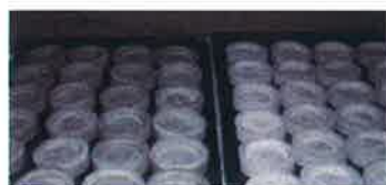
床下に設置したモルタル試験皿の様子